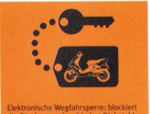
Elektronische Wegfahrsperre: blockiert die Zündung und verhindert Diebstahl.