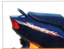
Futuristisches Design symbolisiert Geschwindigkeit auf der ganzen Linie.