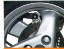
Drei-Speichen-Leichtmetallräder für einen eleganten Auftritt und überlegenes Fahren.