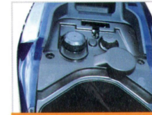
Der Tank: 7,2 Liter Fassungsvermögen für große Reichweiten.