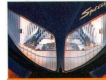
Doppelscheinwerfer mit 35/35W-optimale Sicht unter allen Bedingungen.