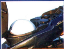
Viel Platz in einem 17 Liter großen Stauraum unter der Sitzbank: z.B. für Integriertehelm, Regenkleidung oder Sicherheitsschlösser.