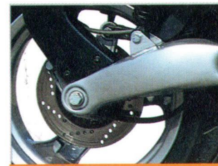
Neuartige Fahrwerkstechnik mit Einarmschwinge: sichere Straßenlage durch wirkungsvollen Anti-Hub-Effekt.