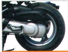
Die gelochte Hinterrad-Bremsscheibe sorgt für optimale Verzögerung.

Mit dem Speedfight 100 und seiner kompletten Serienausstattung erleben Sie das außergewöhnliche Fahrvergnügen. Das aerodynamische Design und der starke Motor verbinden sich zu einer schlagkräftigen Kombination. Der Speedfight 100 bietet modernste Rollertechnik mit dynamischem Outfit und ein unvergleichliches Fahrerlebnis.