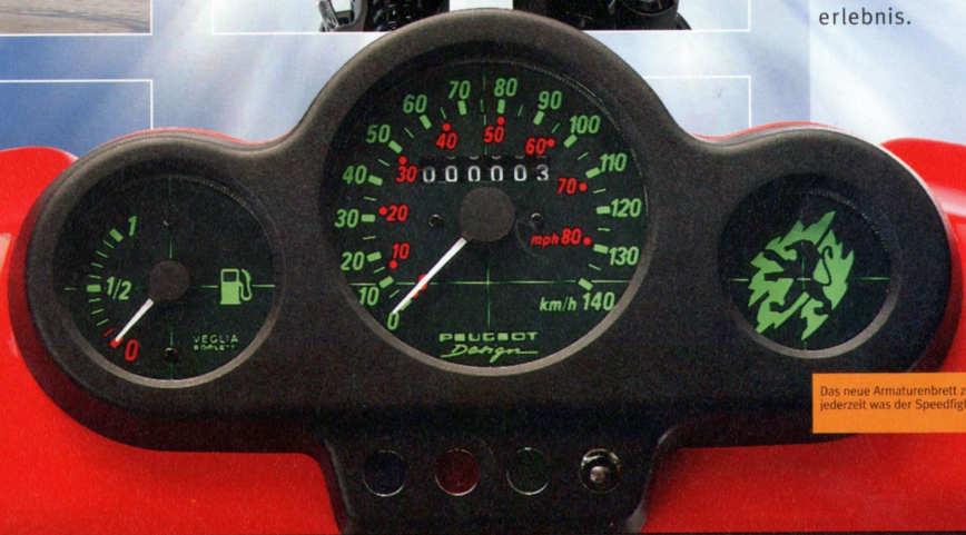
Das neue Armaturenbrett zeigt Ihnen jederzeit was der Speedfight leistet.