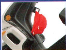
Der integrierte Taschenhaken zum sicheren Befestigen Ihres Gepäcks.