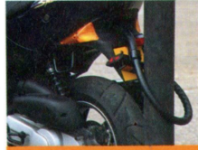
Das integrierte Diebstahlschloß - ein weiterer Beweis dafür, wie ernst Peugeot es mit dem Diebstahlschutz nimmt.